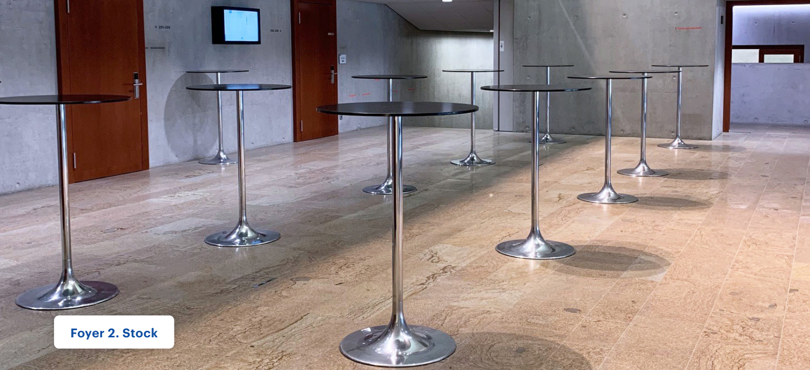
Foyer 2. Stock