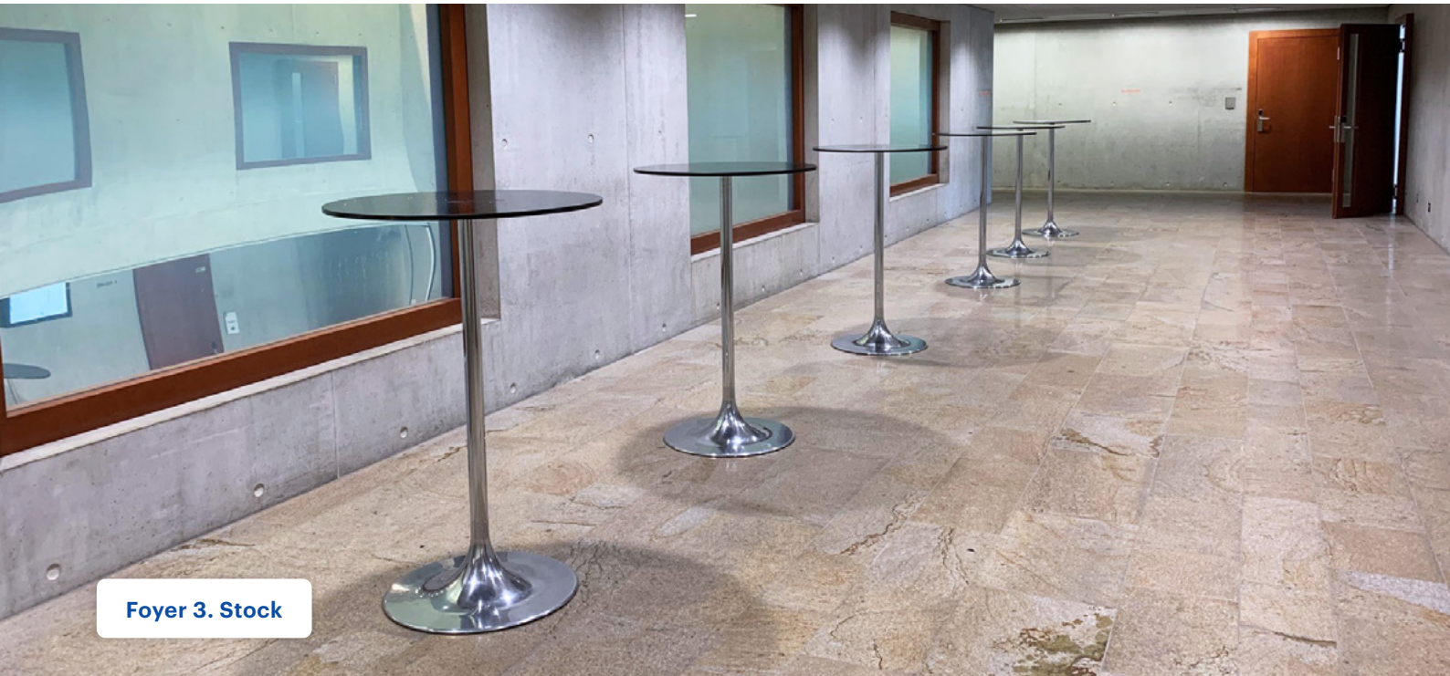
Foyer 3. Stock