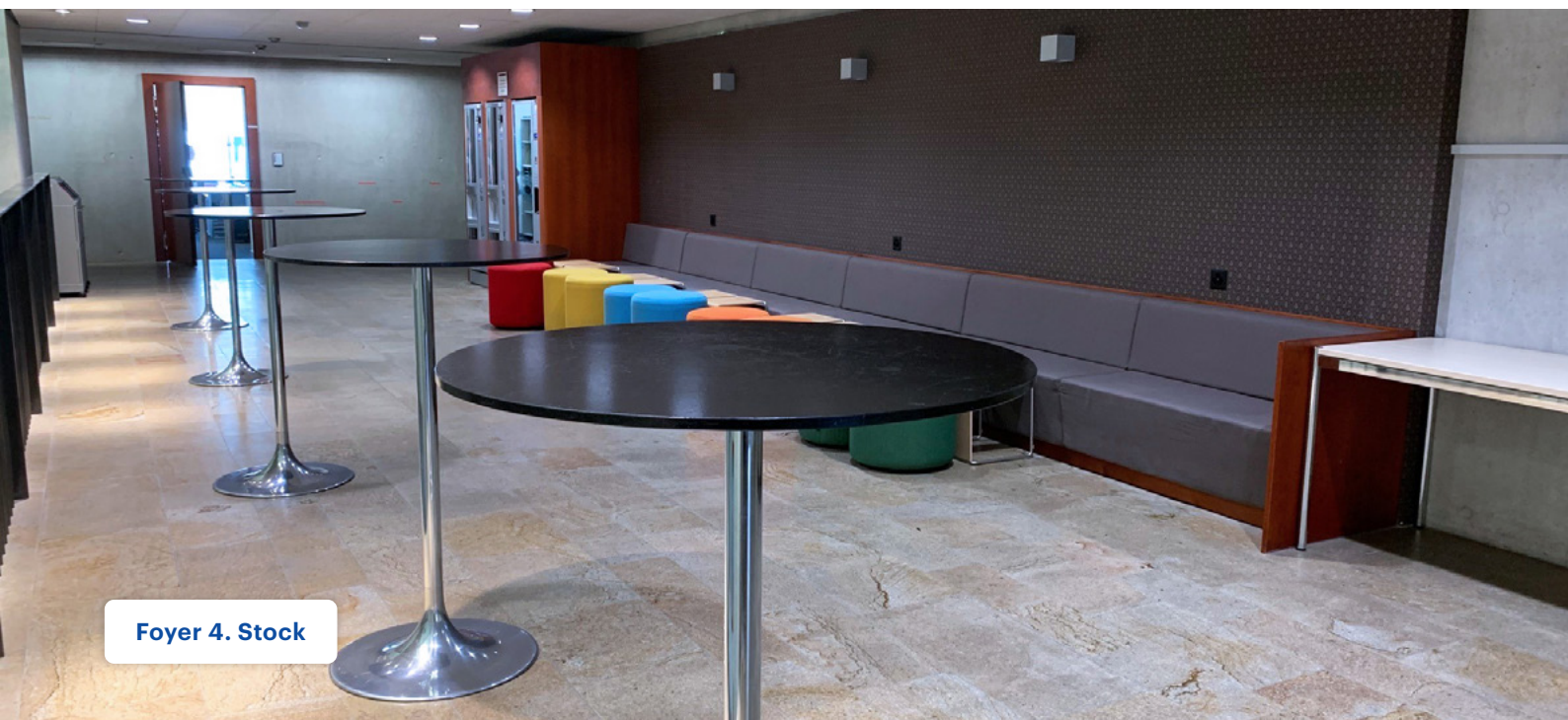
Foyer 4. Stock