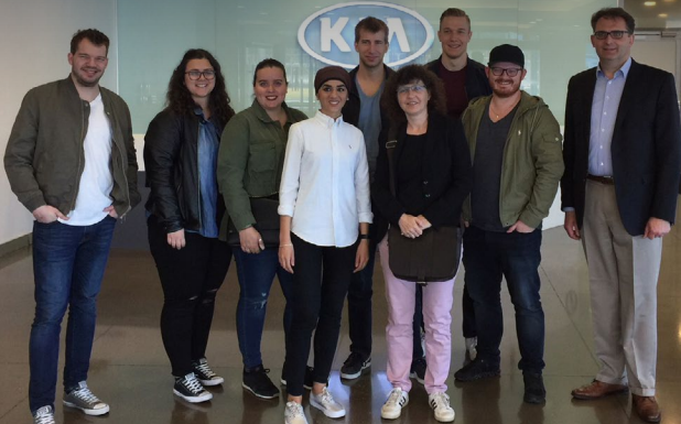
Zu Besuch bei KIA in Atlanta (USA)

Im April 2018 reisten die Studierenden des Minor Accounting/Controlling/Audit des Bachelor Betriebsökonomie nach Atlanta. Dort standen neben dem Besuch von Lehrveranstaltungen an der Kennesaw State University auch spannende Firmenbesuche bei KIA, ALCON und Chick-fil-A auf dem Programm. Ebenfalls nicht fehlen durfte ein Besuch beim Heimspiel der Atlanta Hawks aus der NBA.